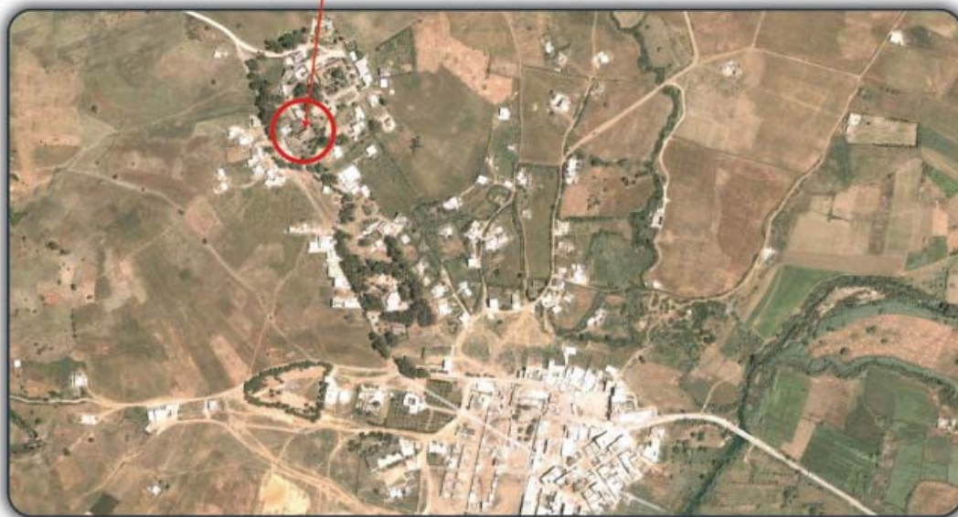
Ferme Psycho-pédagogique Zone Rural Jemis Ánjra. Province de Fahs Ánjra Tanger - Tetouan

La sala de dirección y coordinación dispone de mesa, estanterías, sillas, equipo informático.